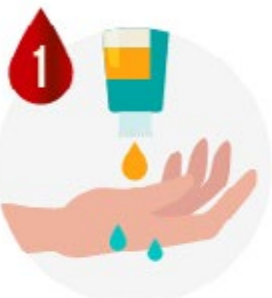
MOULER LES MAINS ET APPLIQUER DU SAVON