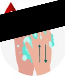
FROTTEZ LE DOS DE VOS MAINS