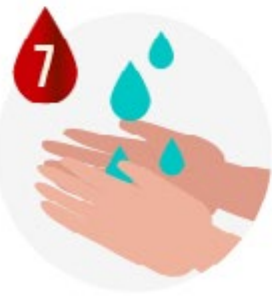
SE RINCER LES MAINS AVEC DE L'EAU