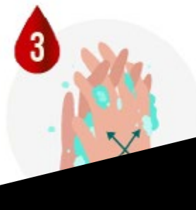
LES DOIGTS ENTRALES