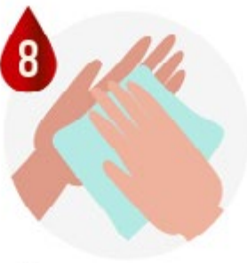
SÉCHEZ AVEC UNE SERVIETTE