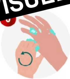
FROTTEZ LA BASE DES POUCES