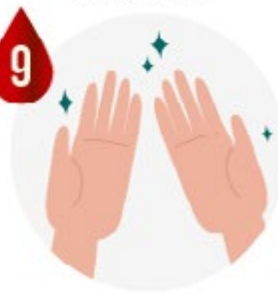
VOS MAINS SONT MAINTENANT PROPRES