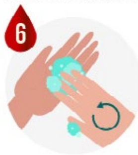
LAVER LE BOUT DES DOIGTS ET LES ONGLES